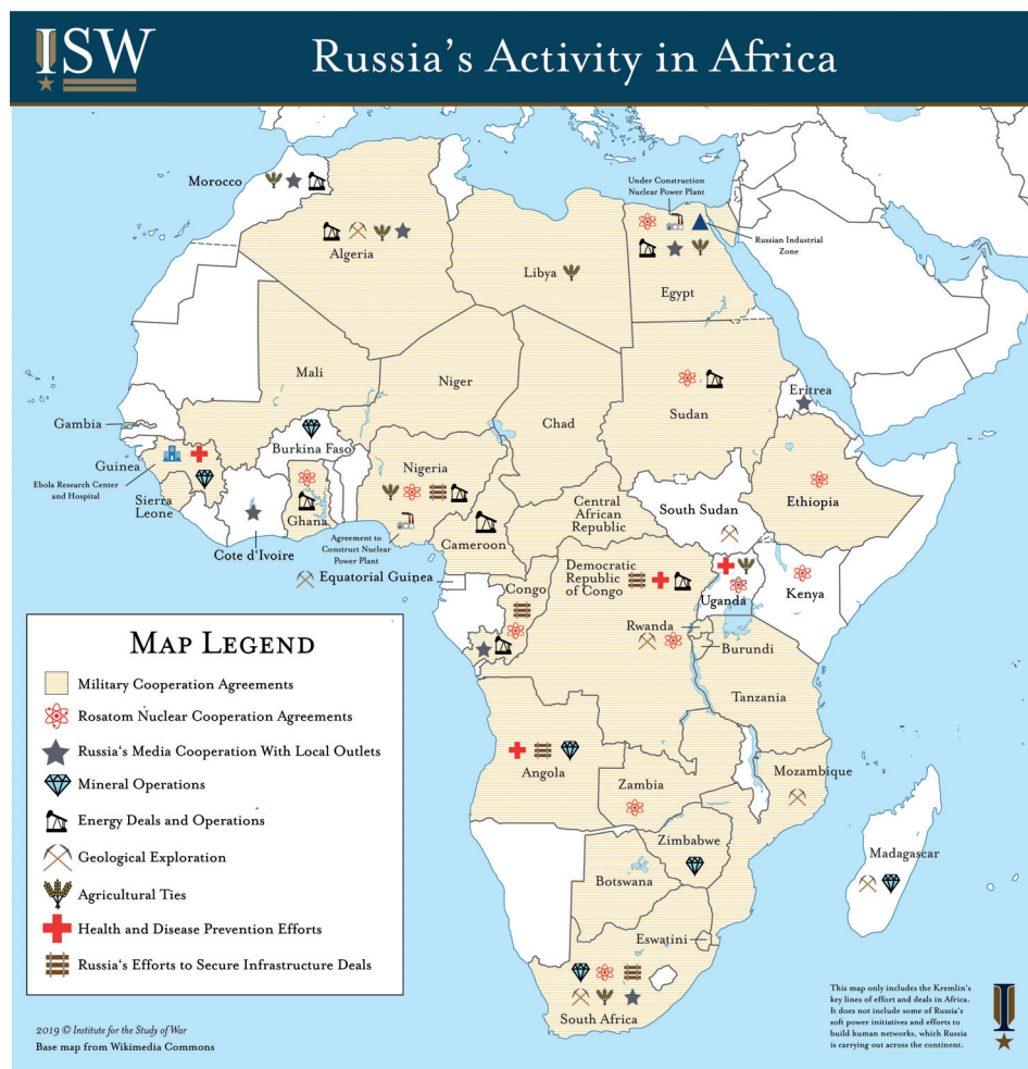
Rycina 1. Obszary rosyjskiej aktywności w Afryce