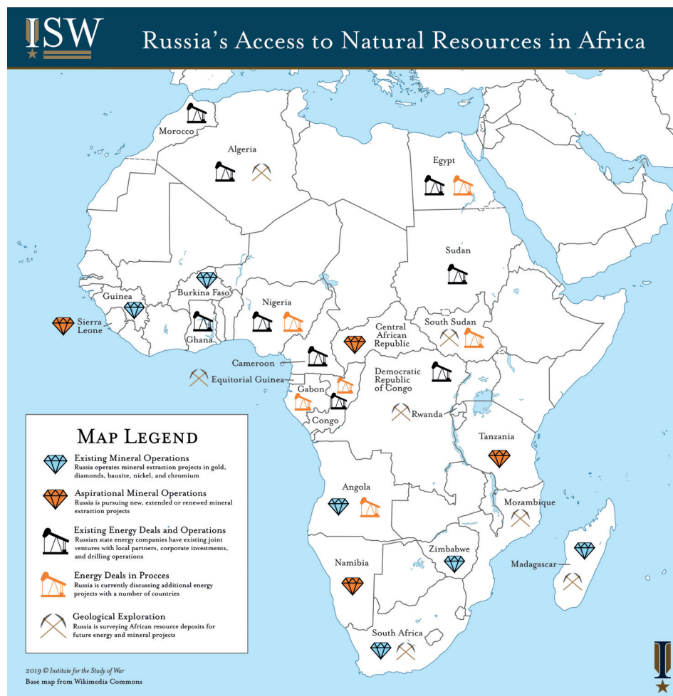
Rycina 3. Rosyjski dostęp do surowców naturalnych w Afryce